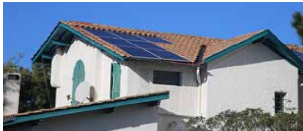
Presbytère du Cap Ferret

Les travaux d'installation ont débuté : 8 sites ont été installés, dont le presbytère du Cap Ferret et de Petit Piquey. 12 autres sites sont en cours d'installation et la fin de cette mise en place est prévue en mars 2017.