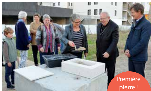
Première pierre !

Nous avons des contraintes financières et il nous faut trouver 600 000 € pour finaliser le financement.